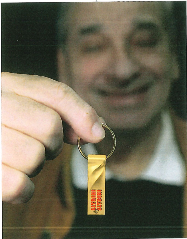
Des programmes complètement cryptés et protégés contre la copie, sur clés USB spéciales

ming, qui s'est révélé là aussi très compliqué et difficile à gérer sans une structure contraignante. C'est la possibilité de créer des programmes complètement cryptés et protégés contre la copie, sur clés USB spéciales, qui nous a convaincus de proposer ça. Seulement deux sociétés proposent ce service, et ça coûte assez cher. Mais d'une part, on tient un support qui ne peut être copié, et d'autre part ces magnifiques clés au design